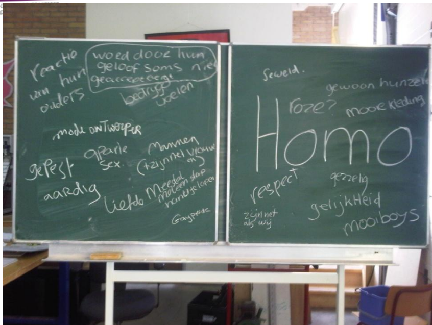
Brainstorm over het woord "homo"

visiteerlingen een indruk van de groepsmeningen van medeleerlingen en de groepsdynamiek bij discriminatie.