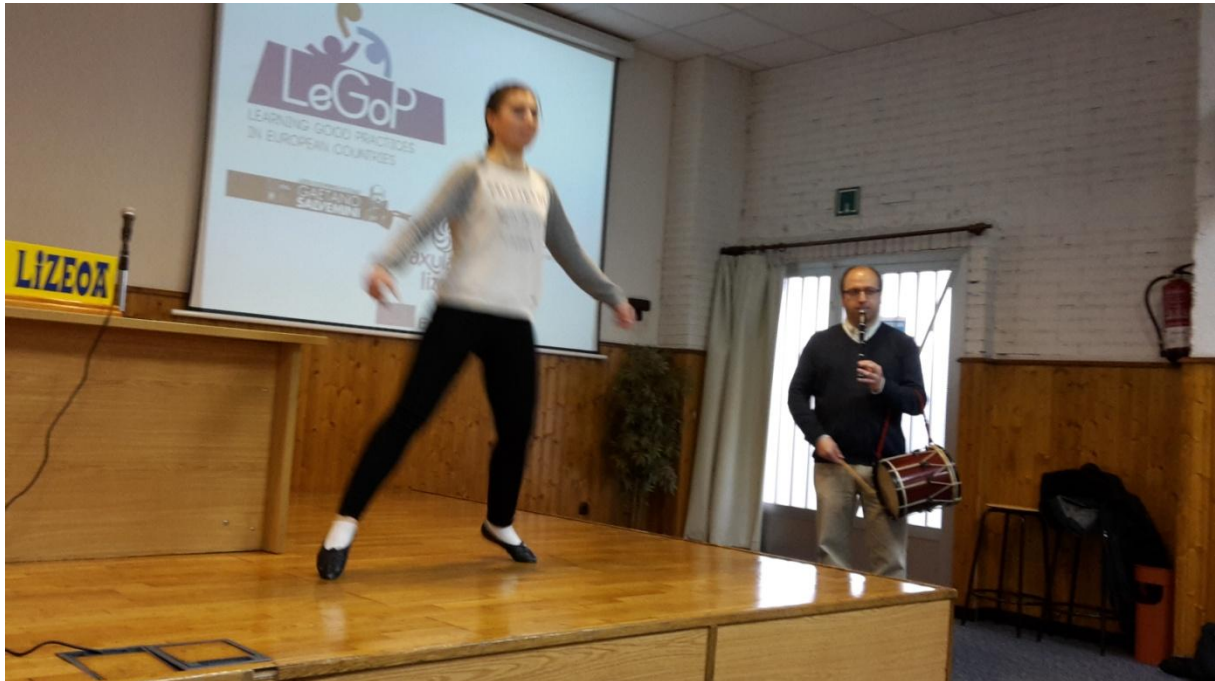
Demonstratie Baskoische dans tijdens internationale uitwisseling

Axular biedt onderwijs aan alle leeftijden, het is een geïntegreerde basis- en middelbare school. Voor wat wij basisonderwijs noemen, gebruikt men geen laptops maar tablets en iPads. De leerlingen die speciale behoeften hebben, werken onder begeleiding van een educatieve psycholoog met applicaties zoals: