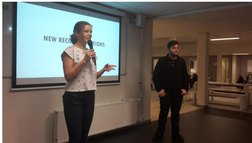
Leerlingen presenteren het advies aan de conferentie

Het laatste onderdeel was een symposium aan het eind van de week. Het symposium was georganiseerd voor en door de leerlingen zelf. Ook de inhoud van het symposium draaide om de leerlingen. Aan het begin van het symposium presenteerden de leerlingen hun aanbevelingen voor een LHBTI vriendelijke school. Vervolgens waren er 6 parallelle ronde