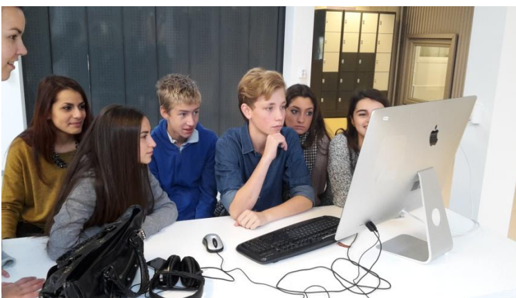
Leerlingen monteren hun voorlichtingsfilm

De voorbereidingsweek begint - na de kennismaking - met het bestuderen van een deel van de tekst van een scène uit de film "Uitgesproken". Deze korte film gaat over twee vrienden, waarbij de ene (heteroseksuele) vriend halverwege ontdekt dat zijn beste vriend homo is. Andere vrienden zijn tegen homo's, dus de hoofdrolspeler moet beslissen of hij bevriend blijft met zijn beste vriend of dat hij meegaat in de homohaat van de peer group . De leerlingen krijgen de tekst van de scène waar de hoofdrolspeler er net achter is gekomen dat zijn vriend homo is, maar daar niets over zegt. De scène heeft weinig tekst en laat daardoor veel