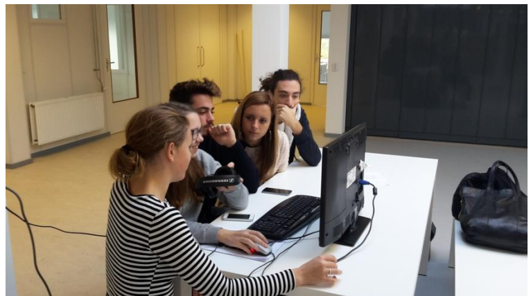
Leerlingen aan de montage

In een volgend onderdeel - op de derde dag - doen de leerlingen een spelwandeling door het centrum van Amsterdam, waardoor ze zowel de stad als de homogeschiedenis wat beter leren kennen. De tocht eindigt achter het Paleis op de Dam en vlakbij Boekhandel Vrolijk. De leerlingen kregen een folder waarin werd uitgelegd dat 300 jaar geleden honderden homomannen met veel bombarie ter dood zijn gebracht voor het paleis (toen stadhuis), en dat er nu vlak daarachter een homoboekhandel is. De leerlingen spraken mensen op straat aan die langskwamen, legden dit uit en interviewden hen over wat ze van de verandering vonden. Omdat 50% van de mensen in het centrum van Amsterdam toeristen zijn, kregen ze een variatie aan internationale meningen te horen.